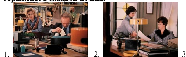
1. 2. 3.

Задание 7. Посмотрите Фрагмент 6 «Заявление» (к/ф «Служебный роман»), расставьте картинки в нужном порядке и расскажите, какие действия персонажей отражены в каждой из них.