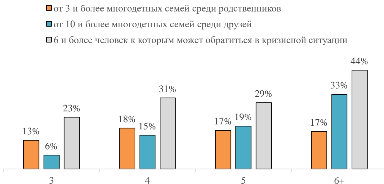
Рисунок 2. Связь количества детей в многодетной семье и параметров социального окружения 13