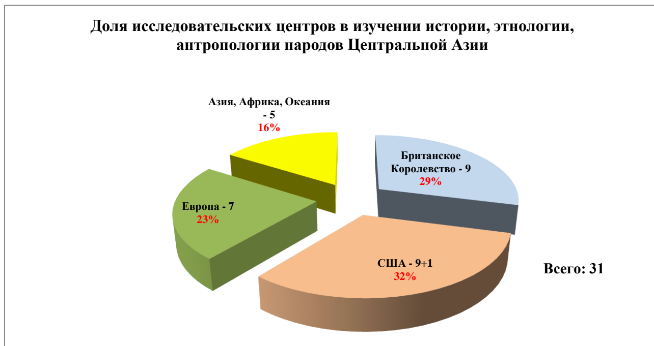
Рис. 2. Доля участия в изучении указанного региона

была проанализирована деятельность этих организаций. Согласно полученным результатам, была составлена диаграмма (см. рис. 2).