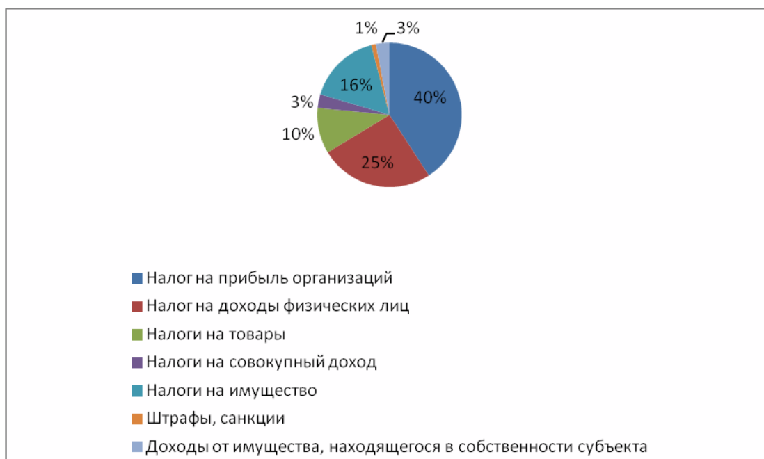
Рис. 1. Структура доходов бюджета Белгородской области на 2018 г.

Так консолидированный бюджет Белгородской области на 2018 год можно представить следующим образом.