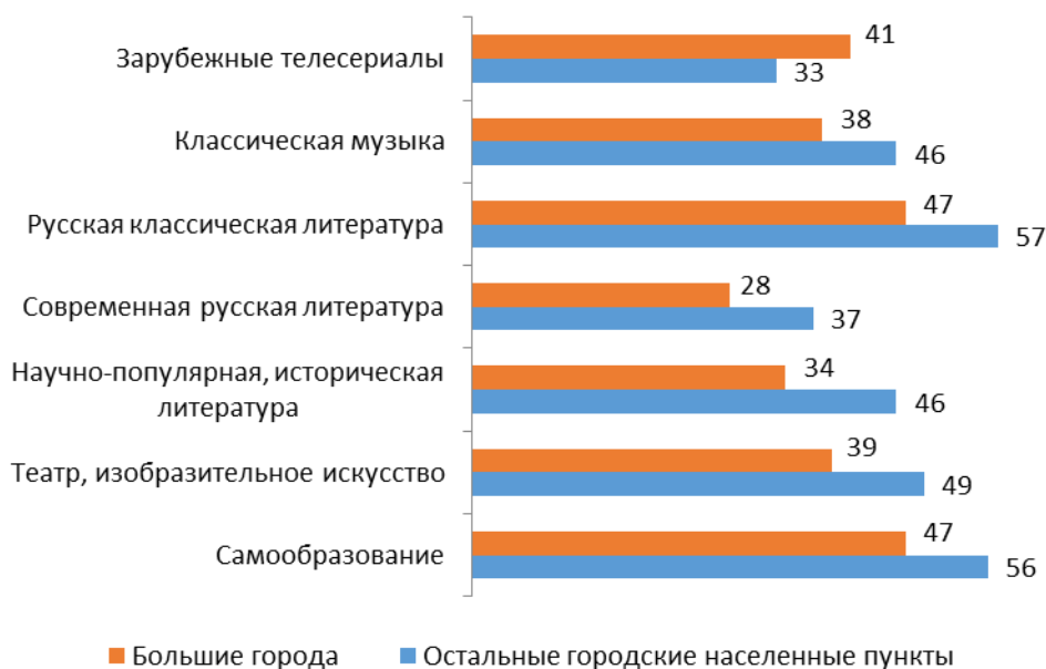
Рис. 1. Предпочтения в сфере культуры (доля в % ответивших «нравится» в каждой целевой группе)