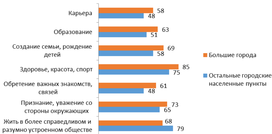
Рис. 3. Ценностные ориентации (доля высоких оценок по шкале важности в % от количества опрошенных в каждой целевой группе)

таты анализа по тем позициям, по которым зафиксированы различия между целевыми группами (7 позиций из 18).