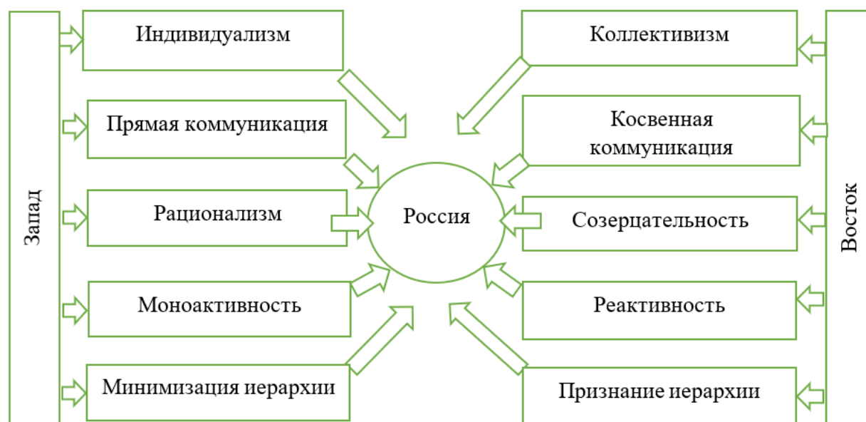
Рис. 2. Россия как арена западного и восточного влияния Fig. 2. Russia as an arena of Western and Eastern influence

Вторая разделительная линия: прямая – косвенная коммуникация, она непосредственно связана с особенностями языка и разделением культур на культуры с низким и высоким контекстом речи (Hall, 1976). Считается, что культурам с низким контекстом речи присуща преимущественно прямая коммуникация, а культурам с высоким контекстом речи – косвенная (Дубровская, 2010: 110).