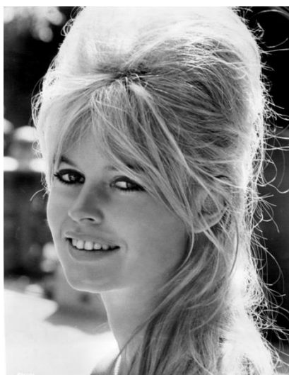
Рис. 9. Прическа исполнительницы главной роли в фильме «Бабетта идет на войну», Брижит Бардо

Другой способ повторить стиль любимых актеров – воспроизведение женских причесок. Прически было легче скопировать, чем модели одежды (Дашкова, 2020: 44). Так, самой известной советской прической 1960-х гг. считается «бабетта», увиденная советскими женщинами во французском фильме «Бабетта идет на войну» (рис. 9).