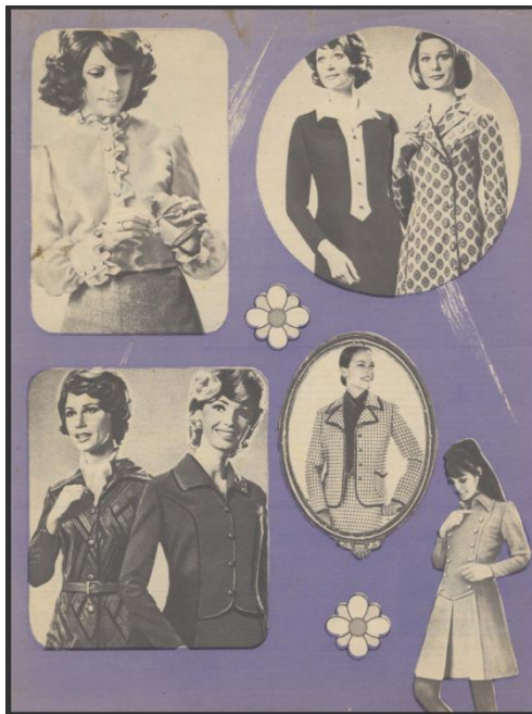
Рис. 6. Зарубежная мода. «Работница». 1974. № 2. Fig. 6. Foreign fashion. Rabotnitsa. 1974. No. 2.

информация о западном образе жизни, доступная читателям модных изданий, была фрагментарной. При публикации материалов зарубежных мод иногда не было даже упоминания о том, в какой стране популярен тот или иной фасон. В частности, в февральском номере «Работницы» за 1974 г. сказано, что за границей в моде «деловые» вещи, подходящие для любого возраста и фигуры. Довольно расплывчатое описание («По-прежнему модны полуприталенные и приталенные силуэты, подчеркнутые крупной строчкой рельефные линии, сквозные застежки, складки») сопровождается фотографиями из европейских журналов мод, авторство которых не указано (рис. 6) 5 . Таким образом, для описания западной моды выбрана информация, которая свидетельствует о сходстве советского и европейского стиля в одежде и доказывает, что советская модная индустрия тоже справляется с удовлетворением потребностей выглядеть красиво.