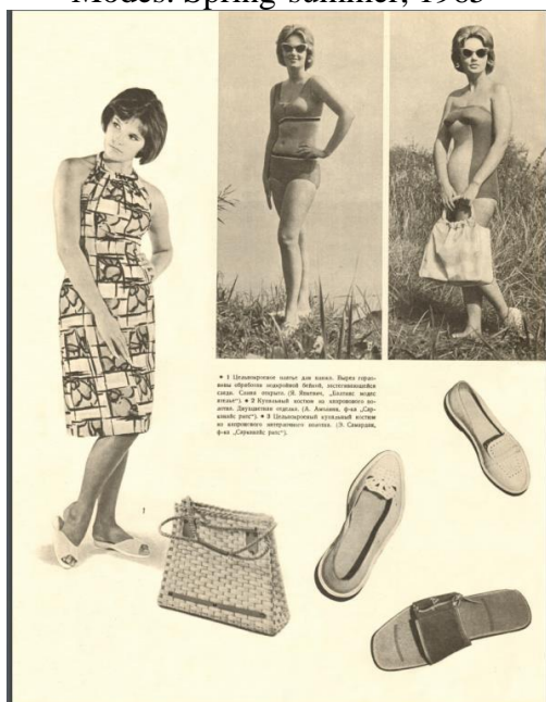
Рис. 4. Образы для повседневной жизни. «Рижские моды». Весна-лето 1965 Fig. 4. Images for everyday life. Rigas Modes. Spring-summer, 1965

Заметим, что для некоторых участников модного дискурса покупка специальных изданий о моде представлялась нерациональным расходом средств. В частности, многие женщины, читающие журналы «Работница» и «Крестьянка», пользовались выкройками, размещенными на последних страницах этих изданий. Это позволяло сэкономить деньги, поскольку в женских журналах читательницы находили и рецепты приготовления блюд, и советы врачей, и новости о государственных мероприятиях, и художественное творчество, и модные образы. Кроме того, язык изложения материалов о стиле в этих журналах был более доступным для широкого круга читателей, чем описание фасонов одежды в «Журнале мод».