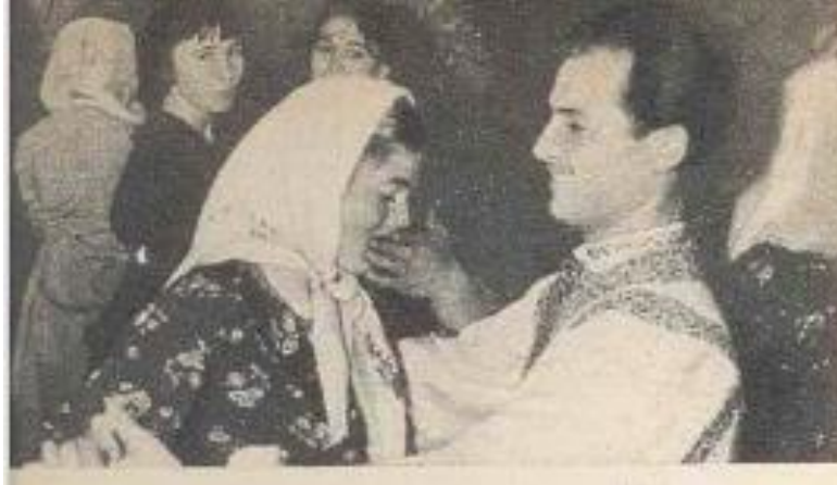
Рис. 1. Участники ситцевого бала. Fig. 1. Participants of the calico ball.

ющие участники бала (рис. 1), из чего следует, что для автора факт победы девушки с определенным фасоном платья не так важен, как описание мероприятия. Важно подчеркнуть, что большинство нарядов были пошиты вручную участницами бала, но оценивал образы художник-модельер, то