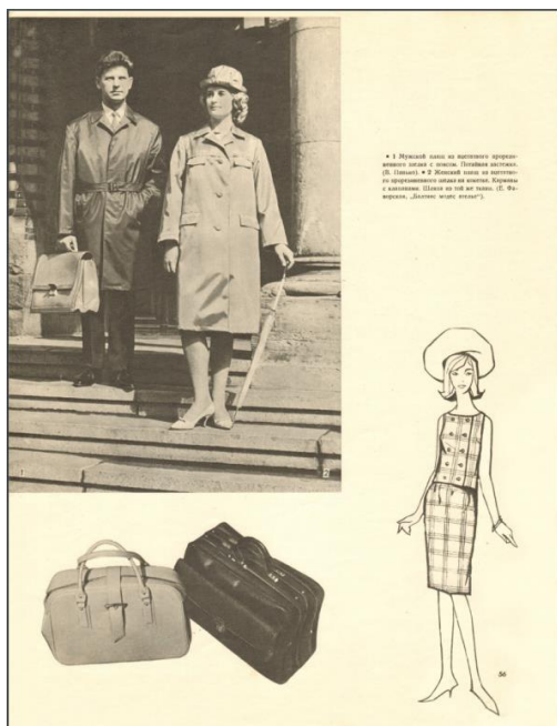
Рис. 2. Образы для повседневной жизни. «Рижские моды». Весна-лето 1965 Fig. 2. Images for everyday life. Rigas Modes. Spring-summer, 1965

дели в обстановке, приближенной к повседневности (рис. 2). Перед нами изображены девушки в шерстяных костюмах на отдыхе (рис. 3), модели в сарафане и обуви с открытым носком, чей образ помечен как подходящий для пляжа (рис. 4). В журнале