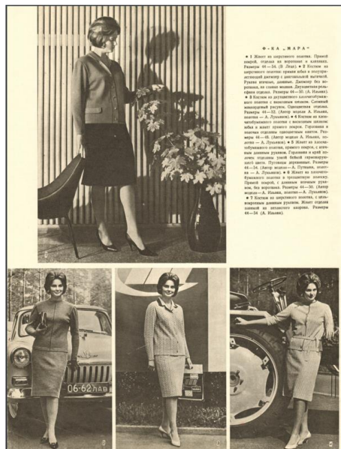
Рис. 3. Образы для повседневной жизни. «Рижские моды». Весна-лето 1965 Fig. 3. Images for everyday life. Rigas Modes. Spring-summer, 1965

представлены костюмы для различных ситуаций – для вечерних выходов, активного отдыха, работы в саду и огороде, домашнего времяпрепровождения и даже ночные рубашки и пижамы для сна.