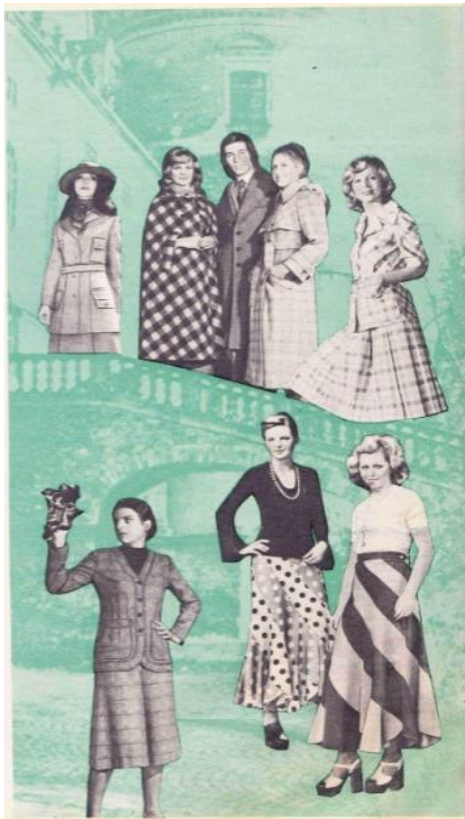
Рис. 5. Образы польской моды. «Работница». 1974. № 7

и представляют читательницам теоретические рассуждения о моде. Так, в № 7 «Работницы» за 1974 г. была размещена «Многоуважаемая мода», которая представляет собой попытку проанализировать модный дискурс в Польше – стране социалистического лагеря. В публикации мода предстает как положительное явление, способствующее развитию легкой промышленности, а женщины, покупающие новые фасоны платьев, называются смелыми и одаренными острым чувством момента. Автор рассказывает о модных в Польше весной 1974 г. «длинных юбках из разноцветных, завихряющихся в спираль полос», которые совершенно не практичны в повседневной жизни, но очень женственны (рис. 5).