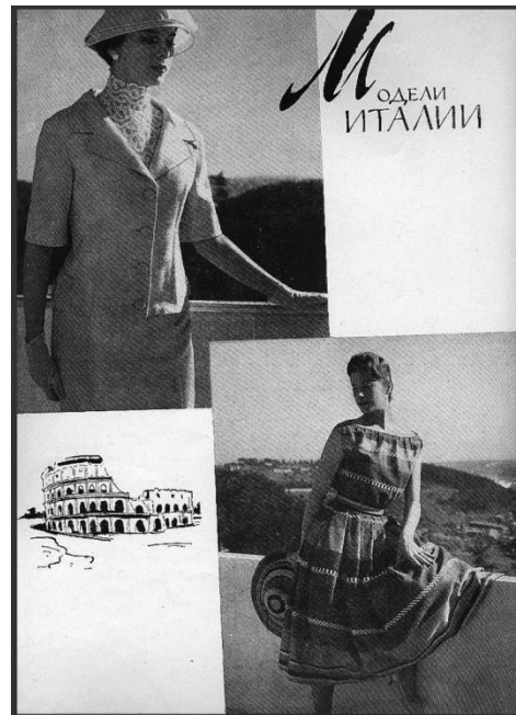
Рис. 7. Модели Италии. Журнал мод. 1958. № 1. Fig. 7. Models of Italy. Fashion magazine. 1958. No 1.

Интересен факт появления в первом номере «Журнале мод» за 1958 г. раздела «Модели Италии». В нем представлены семь фотографий женщин в элегантных платьях и костюмах. При этом фотографии, в отличие от идентичных изображений советской моды, не сопровождаются текстовым описанием. Более того, все они, кроме одной, черно-белые, что затрудняло повторение читательницами образов итальянских моделей. Образы итальянской моды, представленные в этом номере, выглядят довольно стереотипно – красивые женщины в шляпках и перчатках представлены на фоне средиземноморских пейзажей, страницы украшают карандашные зарисовки известных достопримечательностей (рис. 7-8). Таким образом, данная публикация скорее показала иллюстрации культурной жизни европейской страны, чем предоставила образы, которые могли быть легко повторены советскими женщинами.