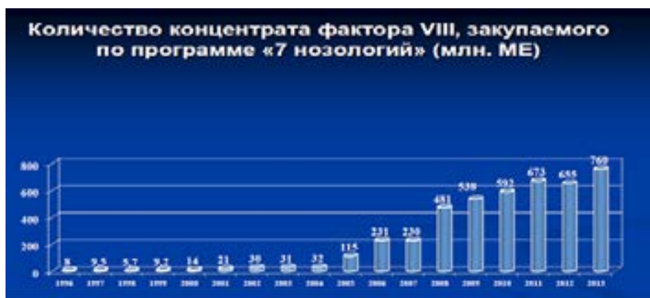
Рис.1 Рост доступности фактора свертывания крови VIII для лечения гемофилии, по данным Ю.А. Жулева (2013 г.)

Нами проведен анализ оценок эффективности лекарственного обеспечения граждан РФ из числа получателей дорогостоящих ЛП. Так, председатель общества больных гемофилией Ю.А.Жулев, в своем докладе в мае 2013 г. сообщил, что доступность ЛП для больных гемофилией повысилась. Например, были приведены данные о количестве факторов свертывания крови VIII, закупаемых, в среднем, на одного пациента (рис.1)