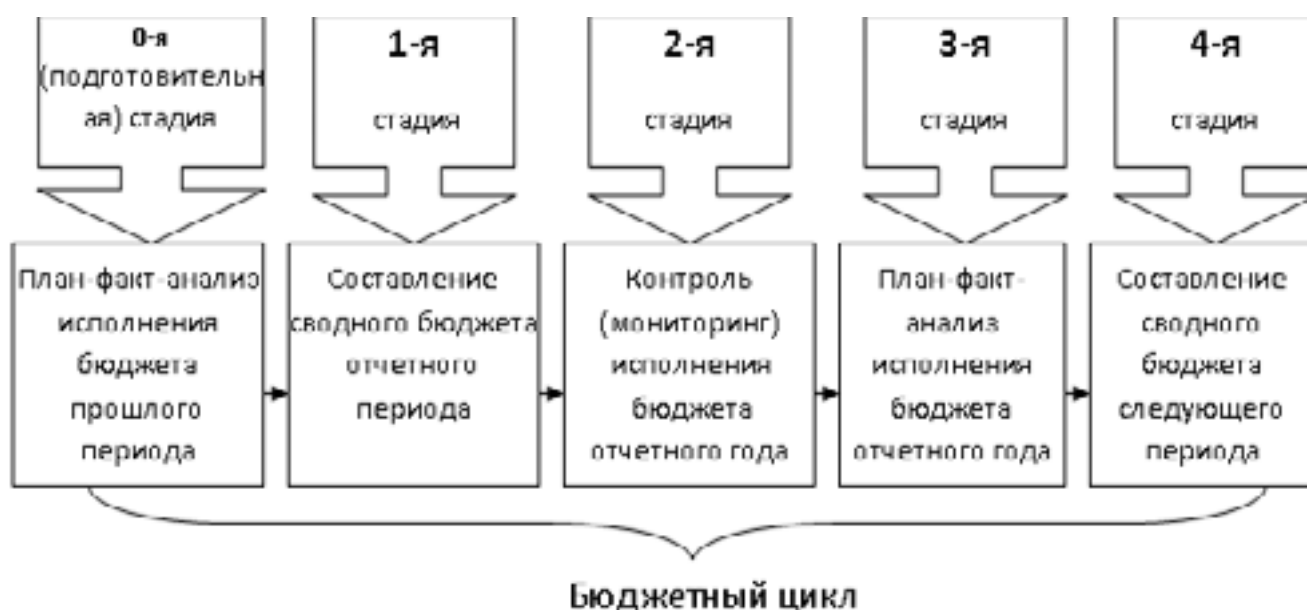
Рис. 1. Стадии бюджетного процесса организаций швейного производства Fig. 1. The stages of the budget process of garment manufacturing businesses

Во-первых, швейные организации должны располагать соответствующей методологической и методической базой разработки, контроля и анализа исполнения сводного бюджета, а работники управленческих служб должны быть достаточно квалифицированными, чтобы уметь применять эту методологию на практике.