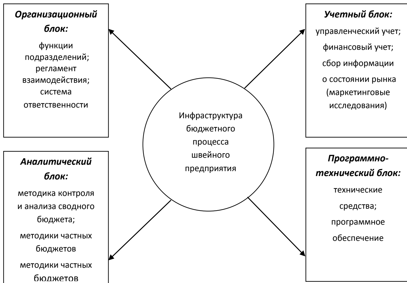
Рис. 2. Схема инфраструктуры бюджетного процесса швейного предприятия

На схеме приведена технология бюджетирования на швейном предприятии. При этом целесообразно упомянуть, что бюджетный процесс не ограничивается составлением сводного бюджета предприятия.