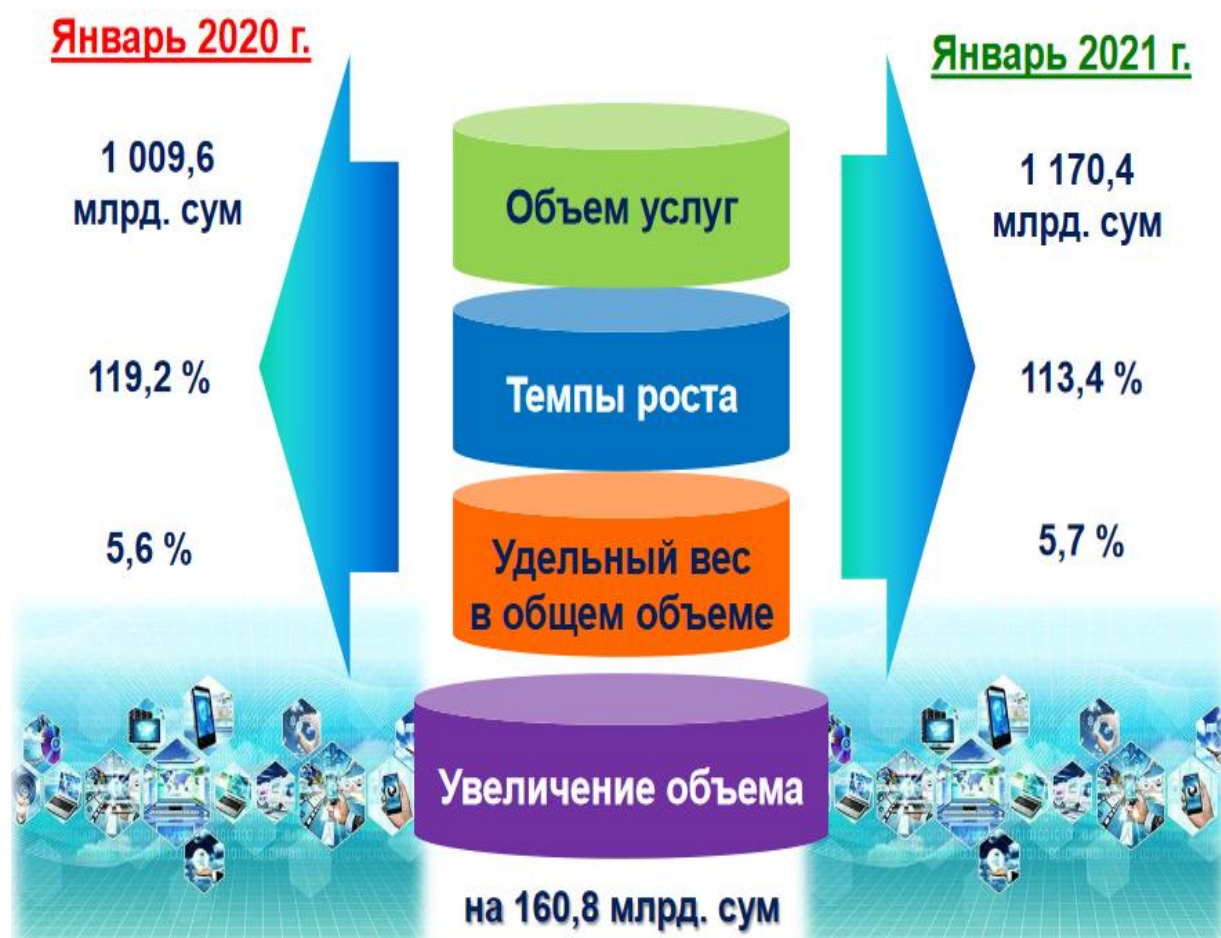
Рис. 1. Услуги связи и информатизации в Республике Узбекистан (данные за январь 2021 года)