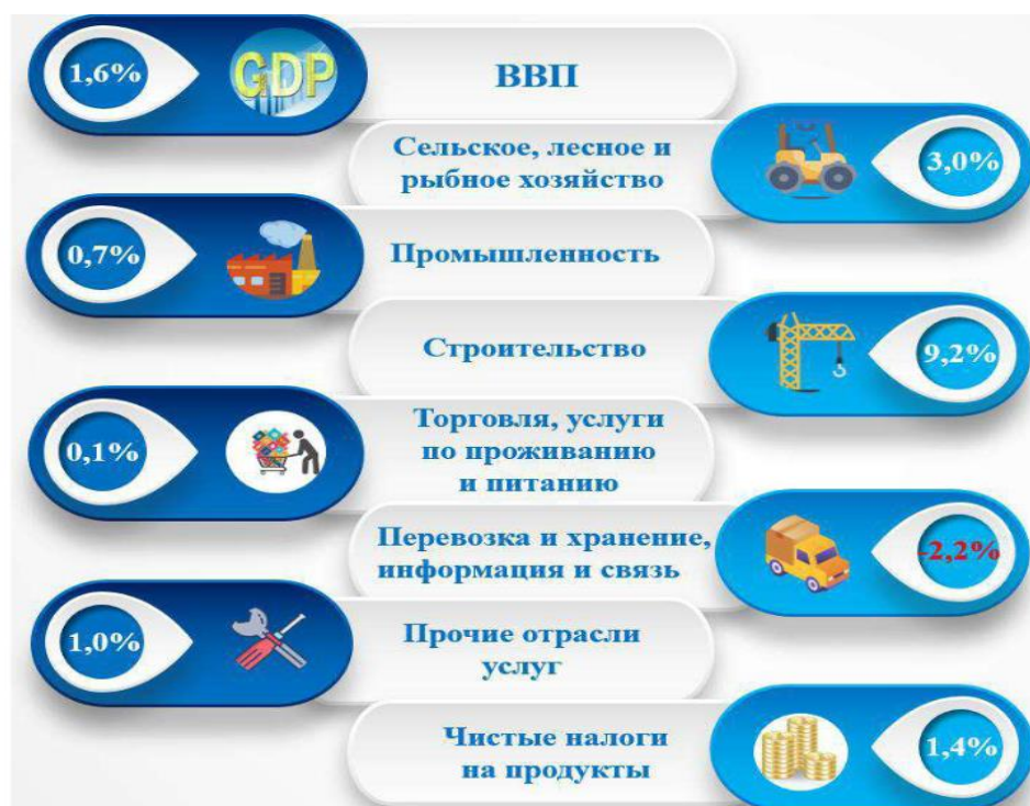
Рис. 3. Темпы прироста ВВП в Республике Узбекистан по видам экономической деятельности за 2020 год (в % к предыдущему году)