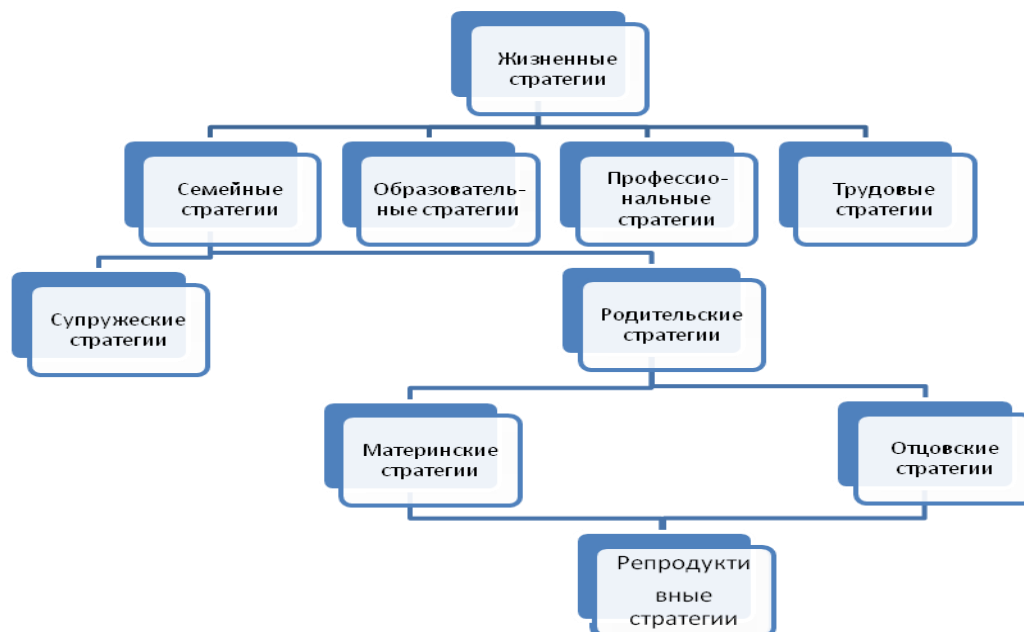
Рис. 1. Структура жизненных стратегий Fig. 1. The structure of life strategies

Материнские и отцовские стратегии в современных условиях имеют трансформирующийся и многовариантный характер. На основе различных критериев дается классификация их типов; при этом также отмечается, что с определенной долей условности, всё их многообразие можно редуцировать к двум основным большим группам: традиционным и современным материнским и отцовским стратегиям. Выделение данных групп идет по линии готовности или неготовности придерживаться сложившихся традиционных гендерных ролей. Традиционные материнские и отцовские стратегии основываются на представлениях о ролях жены как домохозяйки и воспитательницы детей, мужа как добытчика и кормильца; современные – допускают самый широкий репертуар ролей женщин и мужчин в семье. В свою очередь, в рамках этих групп в результате ценностного выбора между семьей и карьерой происходит разделение материнских и отцовских стратегий на семейно-ориентированные, карьерно-ориентированные и интегрированные стратегии. Для семейно-ориентированных материнских и отцовских стратегий характерно подчинение жизни интересам семьи; в карьерно-ориентированных стратегиях приоритет отдается профессиональной деятельности, и акцентируются личные интересы женщины или мужчины; в интегрированных стратегиях семейная и профессиональная сферы признаются